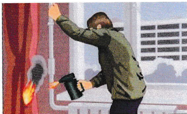
Отогревание замёрзших труб паяльными лампами и факелами