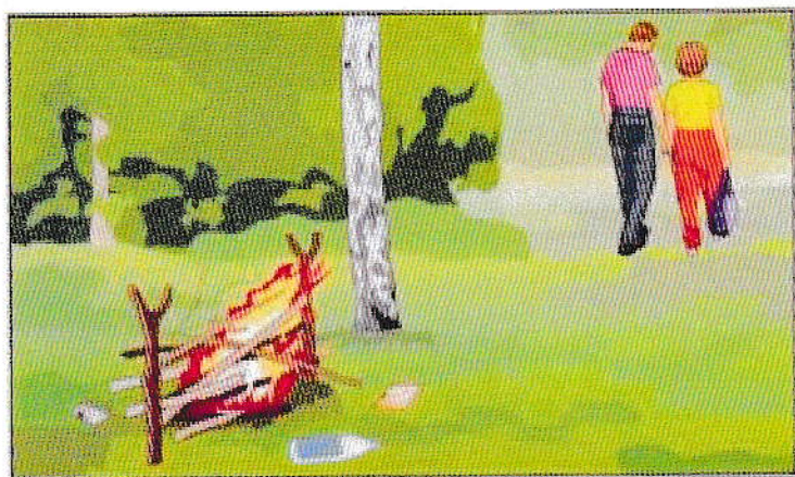
Разведение костров, поджигание сухой травы (палы)