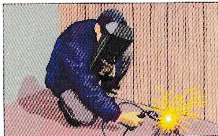
Нарушение правил проведения сварочных работ