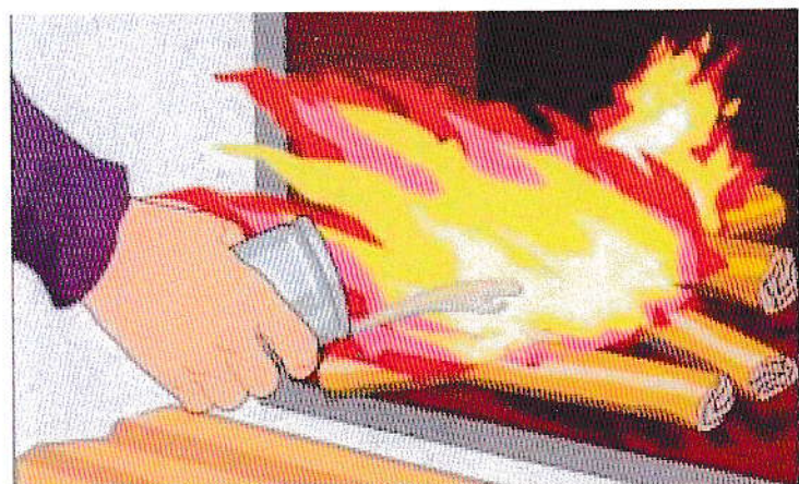
Применение для розжига печей легковоспламеняющихся и горючих жидкостей, выпадение углей, трещины в кладке, возгорание сажи в дымоходах